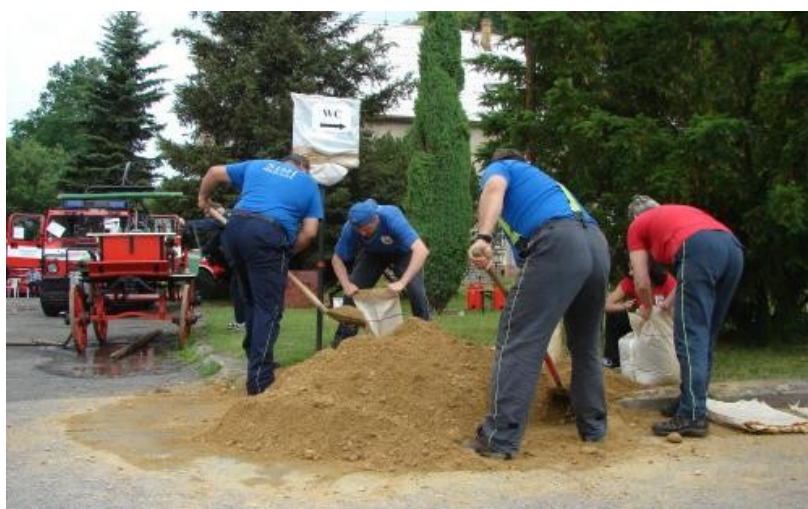
Fotem z akce: „Povodňová lopata aneb 5 let poté,, ( Višňová )