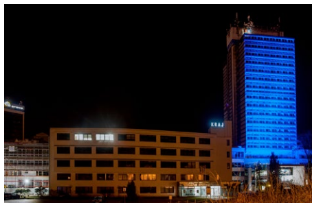
Liberecký kraj tuto akci podpořil již počtvrté.

Do modré barvy se v noci z 2. na 3. dubna oděla budova sídla Libereckého kraje, který se tak opět zapojil do kampaně „Česko svítí modře“. Kampaň na podporu povědomí společnosti o problematice autismu poběží až do konce dubna. Více informací se dozvíte na: www.nadejeproautismus.cz/osveta/cesko-sviti-modre/duben-2019/ .