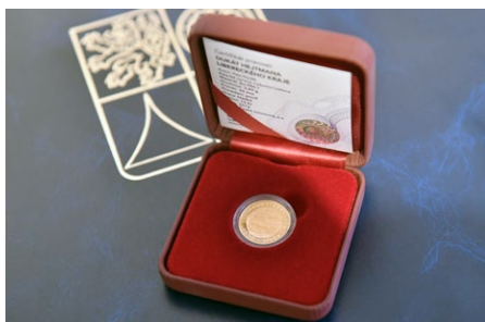
Společně s pamětním listem obdrží laureáti Pocty hejtmána Libereckého kraje také zlatý hejtmanský dukát.

Ocenění Pocta hejtmána Libereckého kraje se každoročně uděluje osobnostem, které se svým celoživotním dílem nebo významným skutkem zasloužily o dobré jméno Libereckého kraje. Již tradičně může výjimečné osobnosti nominovat také veřejnost. Návrhy jsou přijímány do 28. června 2019. Podrobné informace včetně formuláře, který je třeba vyplnit, jsou zveřejněny na webových stránkách kancelar-hejtmana.kraj-lbc.cz/poradane-akce/pocty-hejtmana-libereckeho-kraje-2014/pocty-hejtmana-lk-2019-nominace . Všechny správně podané návrhy budou předloženy pracovní skupině složené jak ze zástupců zastupitelských klubů, tak ze zástupců organizací spjatých s Libereckým krajem. Ta následně navrhne finální seznam osobností. Ocenění ve formě listiny Pocta hejtmána a zlaté mince Hejtmanský dukát jim bude předáno během slavnostního večera, který se bude konat ve středu 30. října 2019 u příležitosti Dne vzniku samostatného československého státu v Oblastní galerii Lázně v Liberci. ←