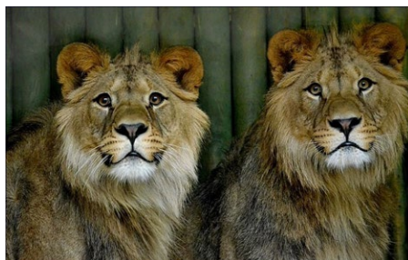
Liberecká ZOO je také domovem vzácných lvů berberských.

Liberecký kraj vyrovná ztrátové hospodaření liberecké ZOO částkou 2,3 mil. Kč, přestože se jedná o příspěvkovou organizaci statutárního města Liberec. „Liberecká ZOO je atraktivitou celého kraje, ne pouze Liberce,