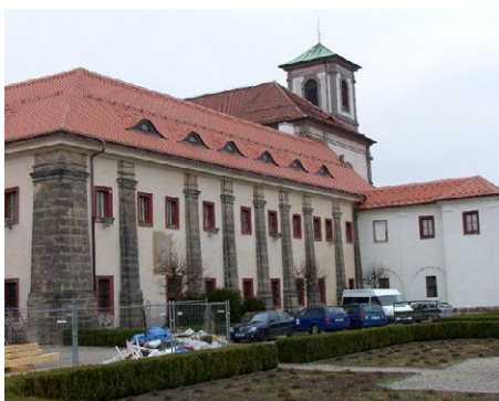
Vlastivědné muzeum a galerie v České Lípě.

Rekonstrukce augustiniánského kláštera, v kterém sídlí Vlastivědné muzeum a galerie v České Lípě, původně počítala pouze s opravou střechy. Díky významným úsporám – kraji se podařilo zakázku vysoutěžít o 10 mil. Kč levněji (z 33 na 23 mil. Kč), bylo možné opravit také omítky a nově i Svaté schody. „Po celkovém dokončení se muzeum stane jednou z výjimečných dominant městské památkové zóny v České Lípě a rekonstrukce jistě přispěje i k tomu, že se zvýší zájem veřejnosti opravené