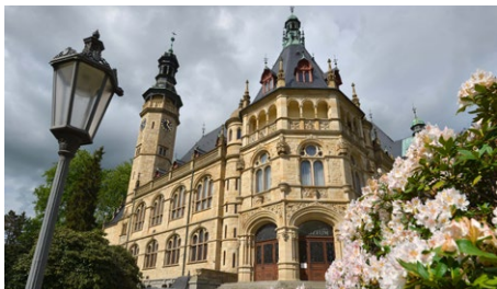
Severočeské muzeum v Liberci.

Letos výjimečně zahajujeme v Liberci Festival muzejních nocí v celostátním měřítku. V pátek 15. května od 17 hodin započne bohatý kulturní program na venkovním pódiu v sousedství galerie, který vyvrcholí ve 23.30 hodin ohňostrojem. Po celý večer mohou zároveň návštěvníci putovat po muzeích a galeriích v Liberci a Jablonci, možné bude cestovat historickými autobusy a tramvajemi. Speciální programy — výstavy, výtvarné workshopy, zábavné akce, představení i koncerty — si připravily Severočeské a Technické muzeum spolu s Oblastní galerií v Liberci, iQ Landia, nově i zoologická a botanická zahrada, v Jablonci pak Muzeum skla a bižuterie a Dům Jany a Josefa V. Scheybalových. Bohatou nabídku občerstvení zajistí regionální výrobci.